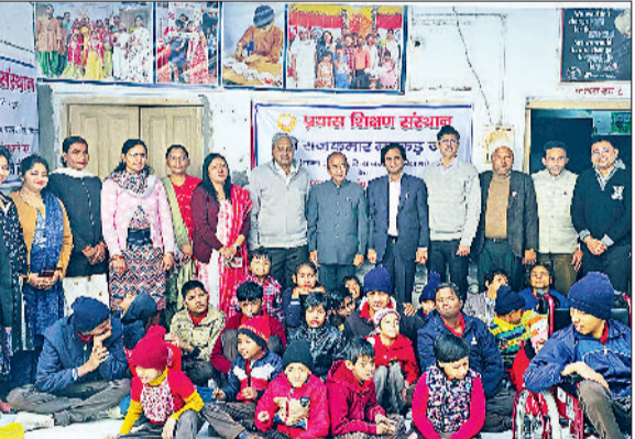
दिव्यांगन राज्य आयुक्त ने प्रयास स्पेशल स्कूल का किया दौरा