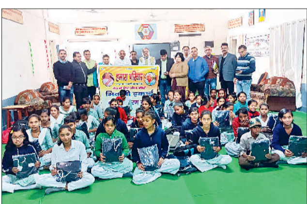
भिवानी। विद्यार्थियों को गर्म वस्त्र वितरित करते अतिथि।