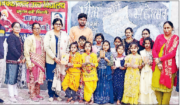
भिवानी। विजेता बच्चों को पुरस्कृत करते अतिथि।

गीता जयंती महोत्सव को लेकर हनुमान ढाणी स्थित विवेकानंद हाई स्कूल में सदाचारी शिक्षा समिति एवं नेताजी सुभाषचंद्र बोस युवा जागृत सेवा समिति द्वारा सांस्कृतिक उत्सव कार्यक्रम का आयोजन किया गया, जिसमें विद्यार्थियों ने गीता को समर्पित सांस्कृतिक प्रस्तुति दी। इस अवसर पर कलाकार विद्यार्थियों को विद्यालय की तरफ से गीता की पुस्तक देकर सम्मानित किया। तीन दिवसीय सांस्कृतिक