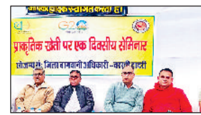
भिवानी। सेमिनार में किसानों को बागवानी की जानकारी देते विशेषज्ञ।