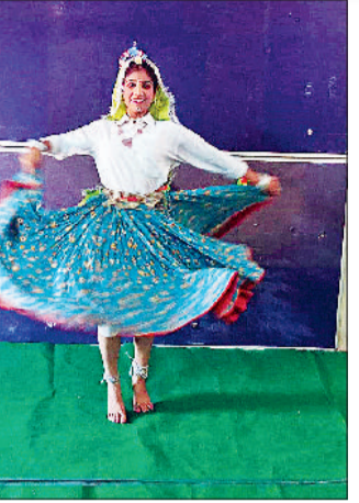
भिवानी। हरियाणवी नृत्य की प्रस्तुति देती छात्रा और पेंटिंग प्रतियोगिता के दौरान पेंटिंग बनाते विद्यार्थी।