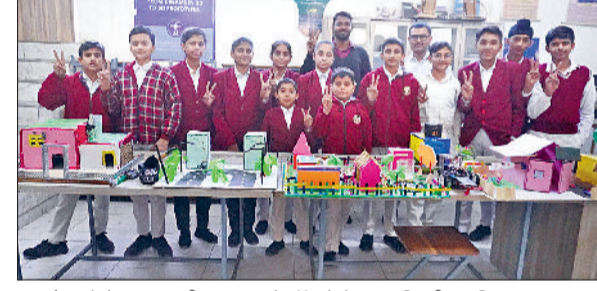
नारनौद। टैगोर स्कूल की छात्रा अपने मॉडलों के साथ विद्वे की चिन्ह बनाए हुए।